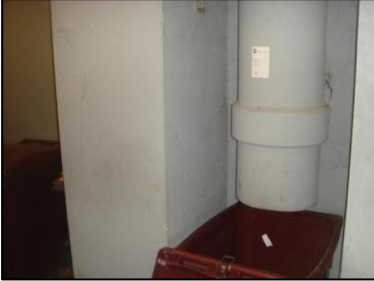
Photo N° 6155 AMIANTE CIMENT - -LOCAL VO RDC à +4 Vide-ordures Gaine V.O.(Fibres-ciment)